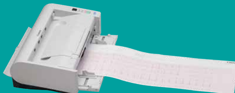
Numérisation de documents longs