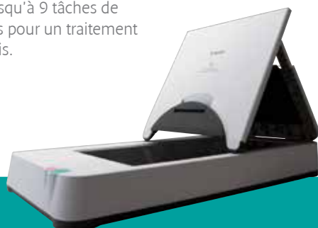
Glace d'exposition A4 Flatbed 101 optionnelle

eCopy PDF Pro Office est une application de bureau puissante et simple qui permet de créer, modifier et convertir des documents PDF plus facilement que jamais.