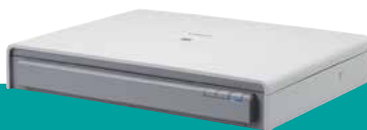
Glace d'exposition A3 Flatbed 201 optionnelle